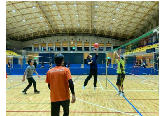
毎週木曜開催ソフトバレーサークル